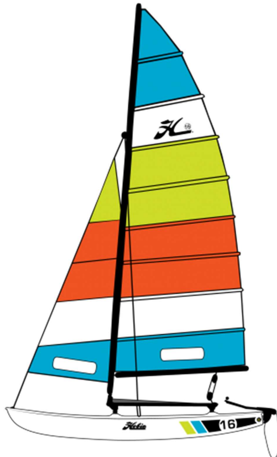
Bild 46: Der (tatsächlich) berühmte Hobie Cat 16 von 1971 wird immer noch gebaut.

16 Worte zum gelben Segelflugmodell aus Kalifornien, das den Lila Socrat auf Bild 45 frech in den Hintergrund drängt: Die Verwandtschaft des Hobie Hawk mit dem (wirklich) berühmten Hobie Cat ist an seinen verbogenen Flügeln zu erkennen.