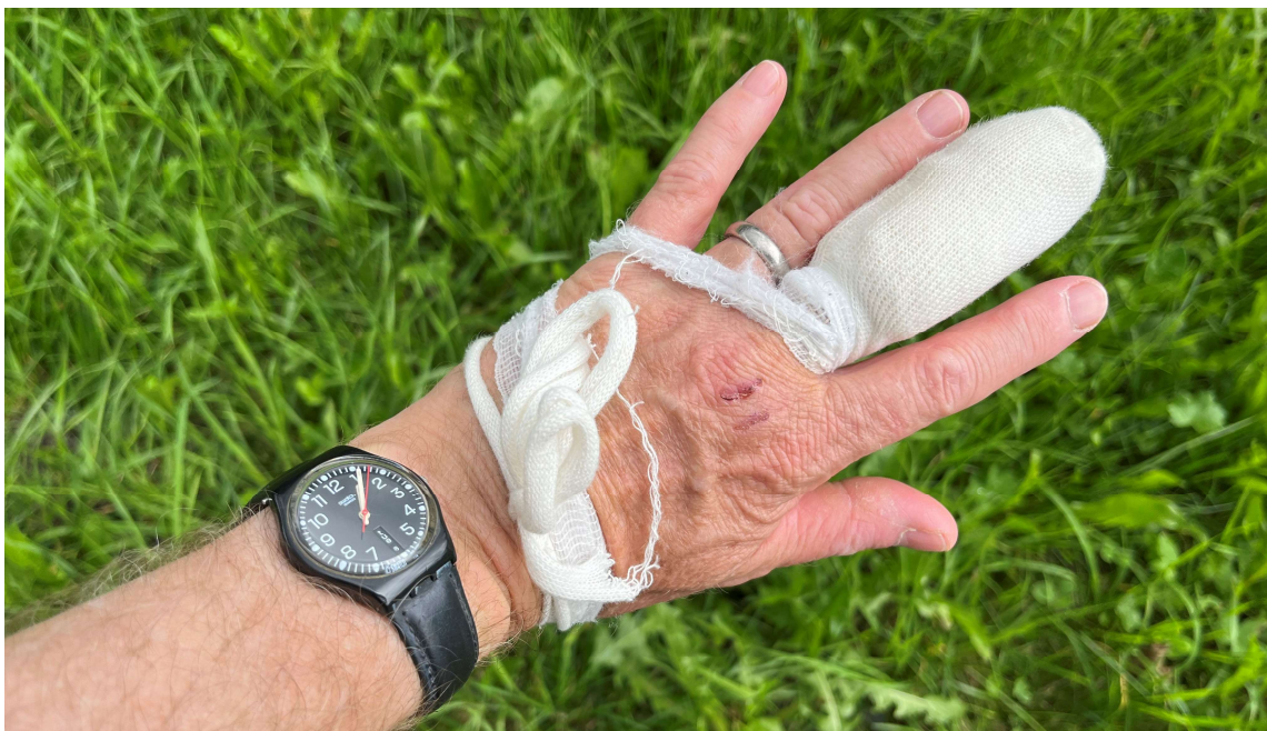
Bild 48: Auch mit einem kleinen Elektroantrieb ist nicht zu spassen.

2024 soll ein Socrat-Flugjahr werden. Deshalb befinden sich gleich drei Socrats in meiner Werkstatt in Restauration. Die Arbeiten am Jonny Socrat mutieren zum ewigen Werk. Immer wieder sinkt meine Arbeitsmoral auf den Nullpunkt. Der im SNL 03 gezeigte Elektromotoraufsatz hat – wie bereits berichtet - nicht auf Antrieb funktioniert. Beim ersten Motorenstart stieg Rauch auf - und etwas später wurde mein linker Mittelfinger vom Propeller arg in Mitleidenschaft gezogen. Ich erhielt deshalb im Spital Zweisimmen eine Starrkrampf-Impfung. Doch jetzt nehme ich die verbleibenden Arbeiten wieder auf. Allenfalls fliegt der Jonny Socrat auch ohne Motoraufsatz. Das Modell hat einen Hochstarthaken; wie die meisten Socrats.