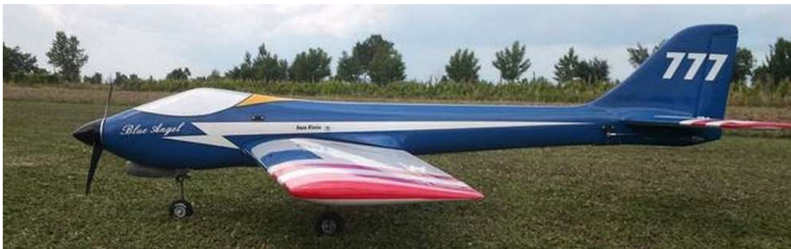
Bild 49: Der elegante Blue Angel gewann die RC-1 WM von 1973 in Gorizia, Italien