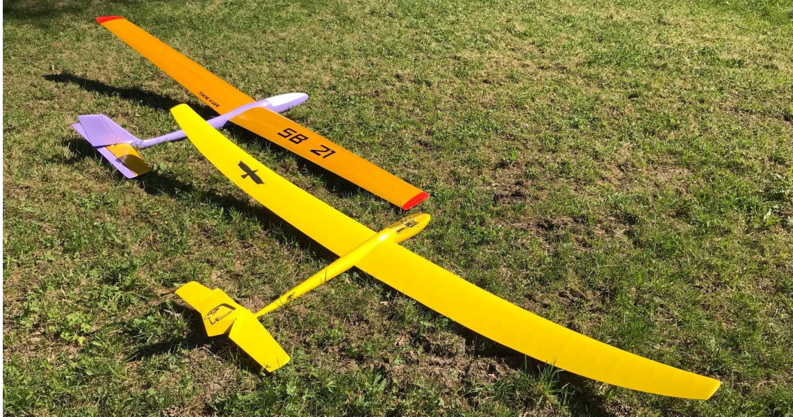
Bild 45: Beat Jäggi fliegt an Ostern 2022 mit Lila Socrat und Hobie Hawk.

16 Worte zum gelben Segelflugmodell aus Kalifornien, das den Lila Socrat auf Bild 45 frech in den Hintergrund drängt: Die Verwandtschaft des Hobie Hawk mit dem (wirklich) berühmten Hobie Cat ist an seinen verbogenen Flügeln zu erkennen.