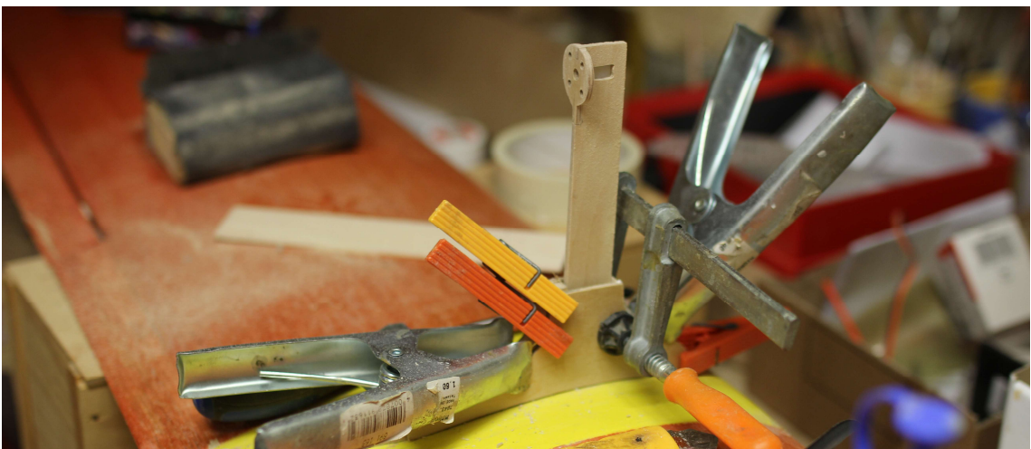
Bild 35: Blick in die Werkstatt: Jonny Socrat erhält einen demontierbaren Motoraufsatz.

Seit meiner Pensionierung per 1. Juli 2023 stehe ich wenig in meiner Werkstatt.