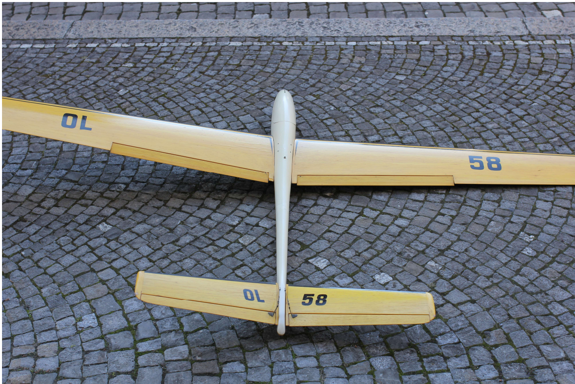
Bild 27: Die Beschriftung OL 58 ist gemalt. Man beachte die Landeklappen.