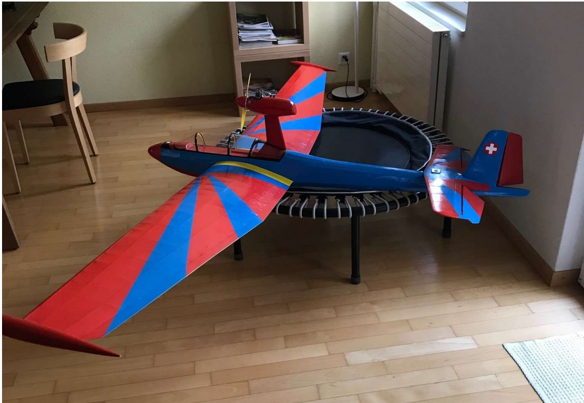
Bild 26: Segelflugmodell Ärgernis in ganzer Grösse ausserhalb der Schachtel.

Kennt jemand dieses spezielle Segelflugmodell? Markant sind die Keulen an den Flügelenden, welche in den 1950er und 1960er-Jahre in Mode waren. Der Motoraufsatz ist riesig, vermutlich mit grossem Tankinhalt. Solange nicht das Gegenteil bewiesen ist, ordnen wir das Modell Hugo Amsler zu.