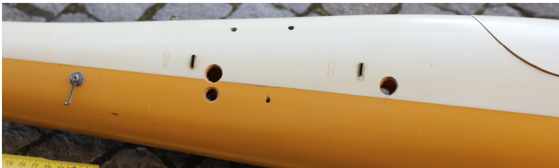
Bild 30: Links ist der Klappenantrieb an der Rumpfaussenseite ersichtlich.