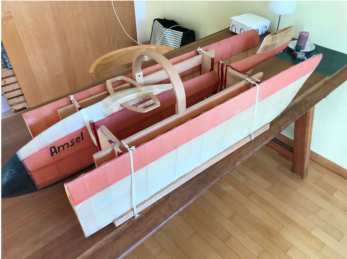
Bild 24: Segelflugmodell Amsel demontiert und in einem speziellen Transportbehältnis.