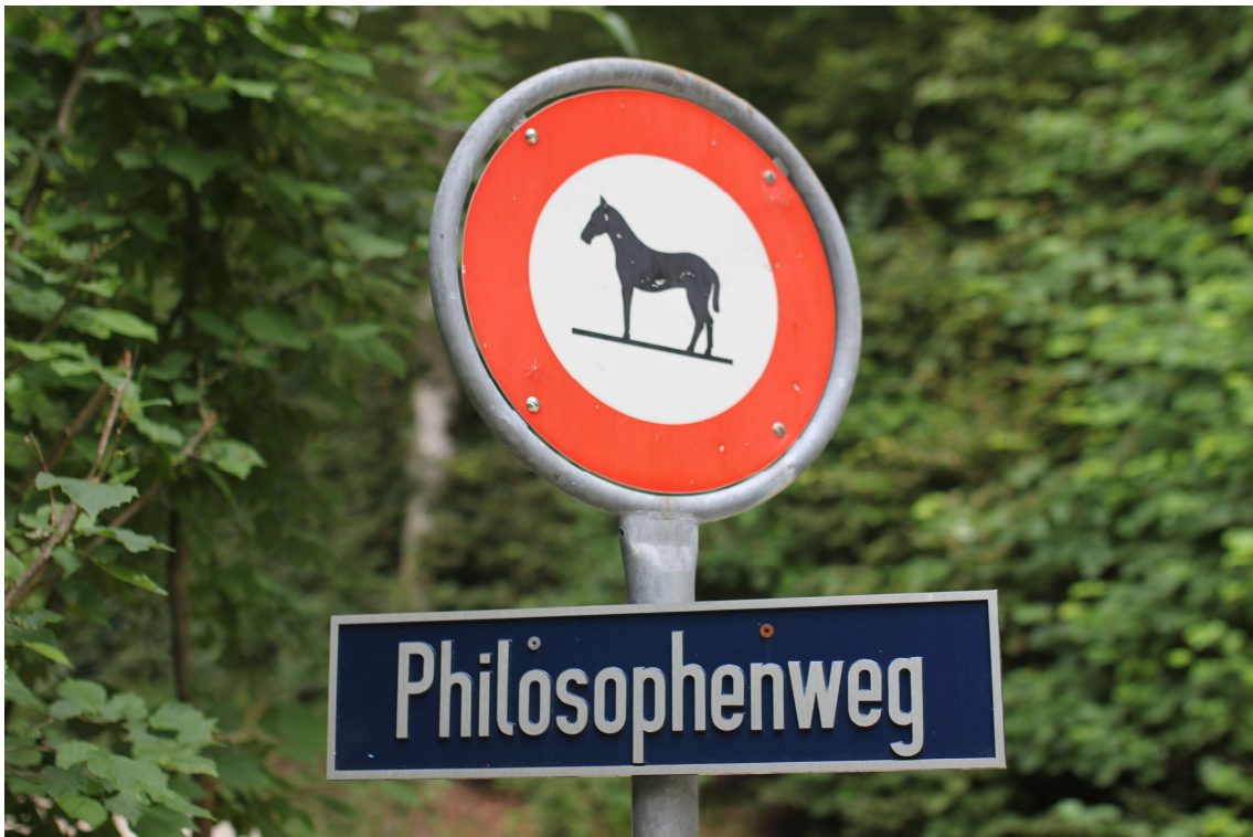
Bild 37: Nicht nur in Griechenland, sondern auch in Zofingen wird philosophiert – und zwar nicht vom hohen Ross herab!