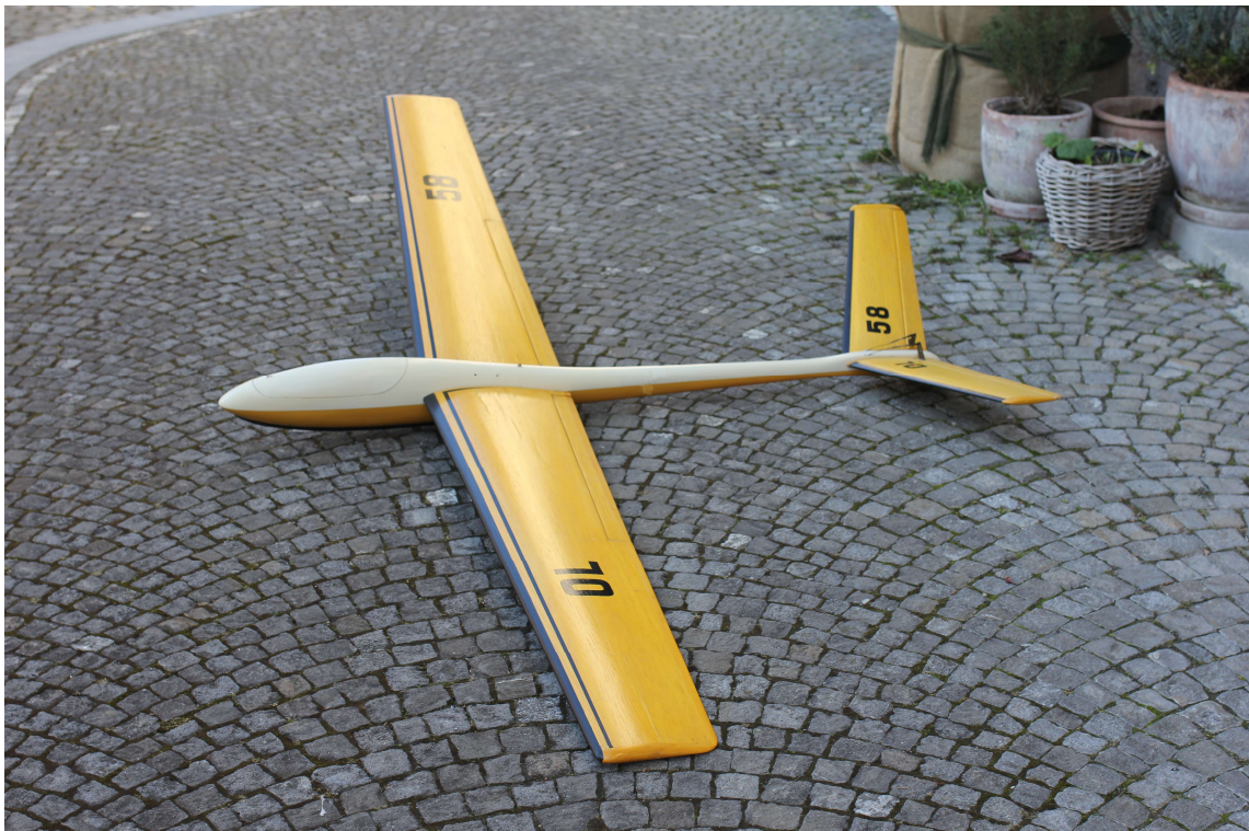
Bild 28: Unikum OL 58: Geringe V-Form der Flügel; flacher Öffnungswinkel des V-Leitwerkes